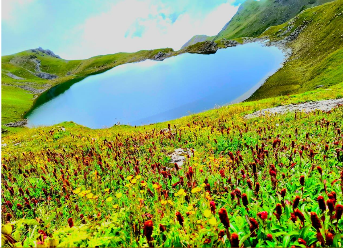
शंख दह बारेकोट