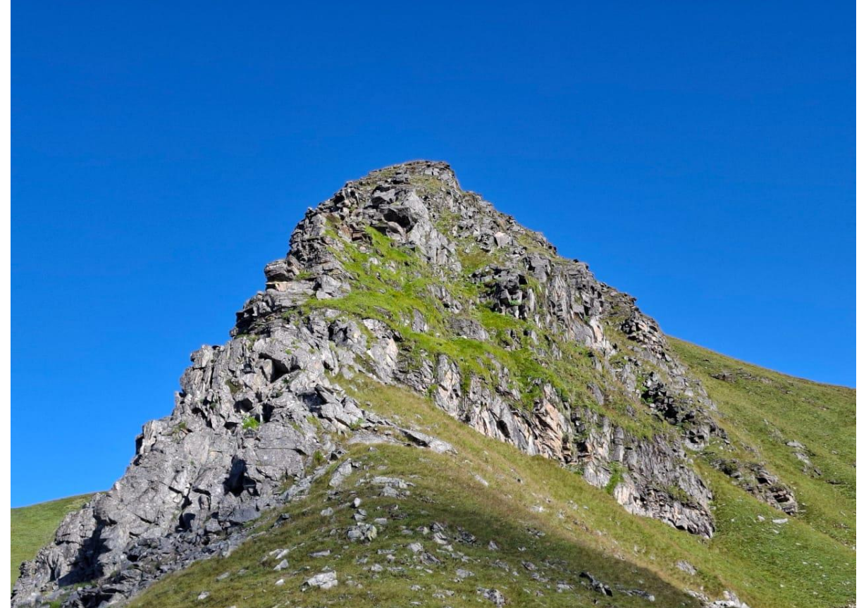
पाटनको उच्च भाग