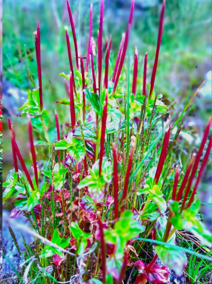
पाटन क्षेत्रमा पाइने बुकी फूलहरु