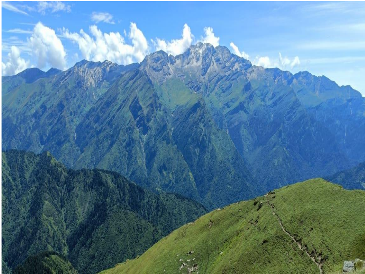
जाजरकोटको सर्वोच्च शिखर कराईचुली हिमाल