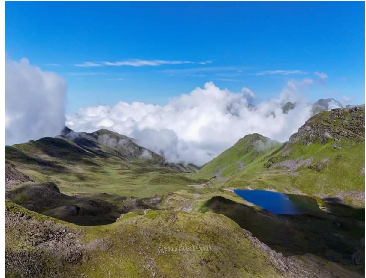
बारेकोट पाटन क्षेत्र