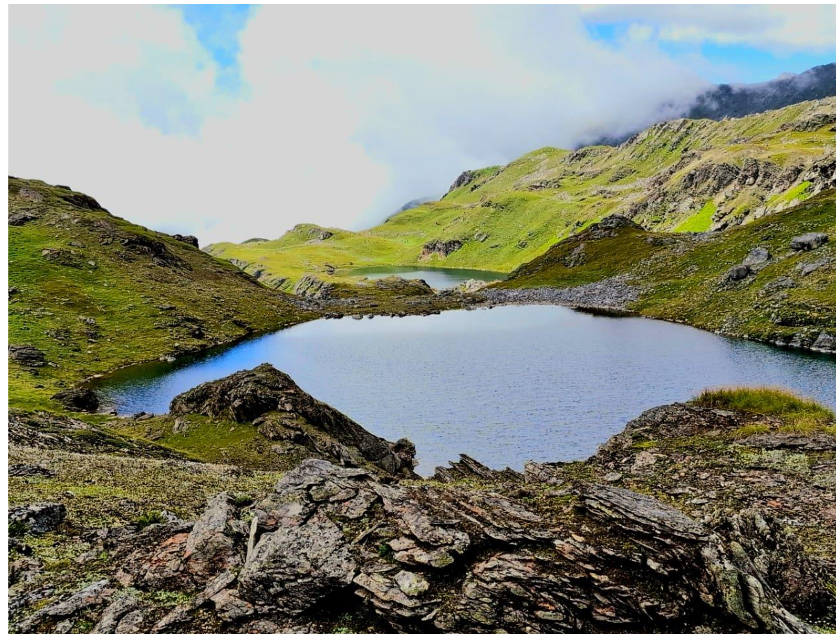
बारेकोट पाटन क्षेत्र