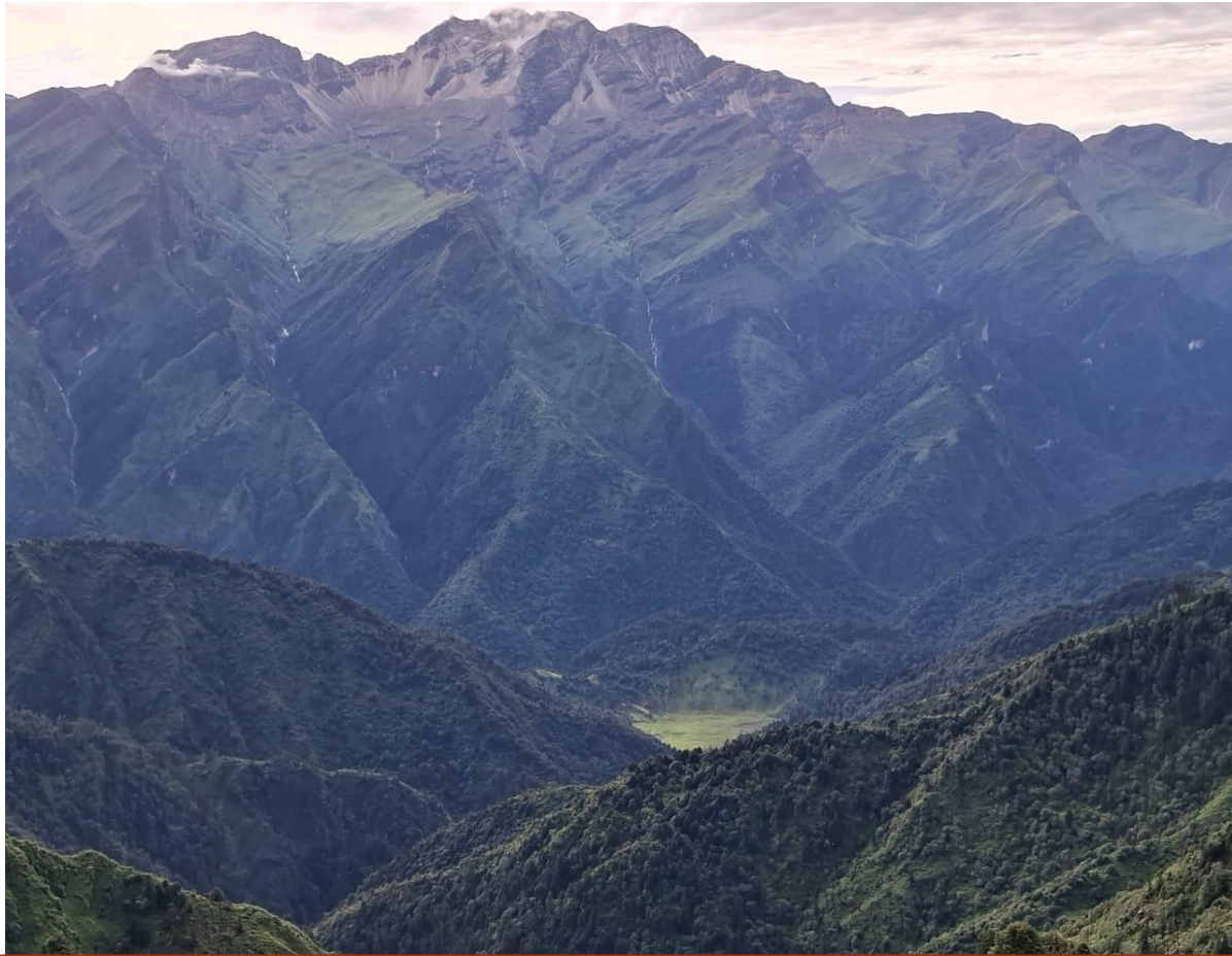
जाजरकोटको सर्वोच्च शिखर कराईचुली हिमाल