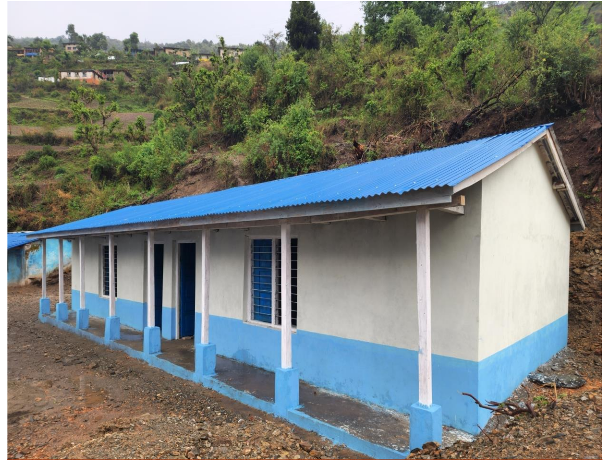
श्री हरिहर आधारभूत विद्यालय २ कोठे भवन निर्माण बारेकोट ७