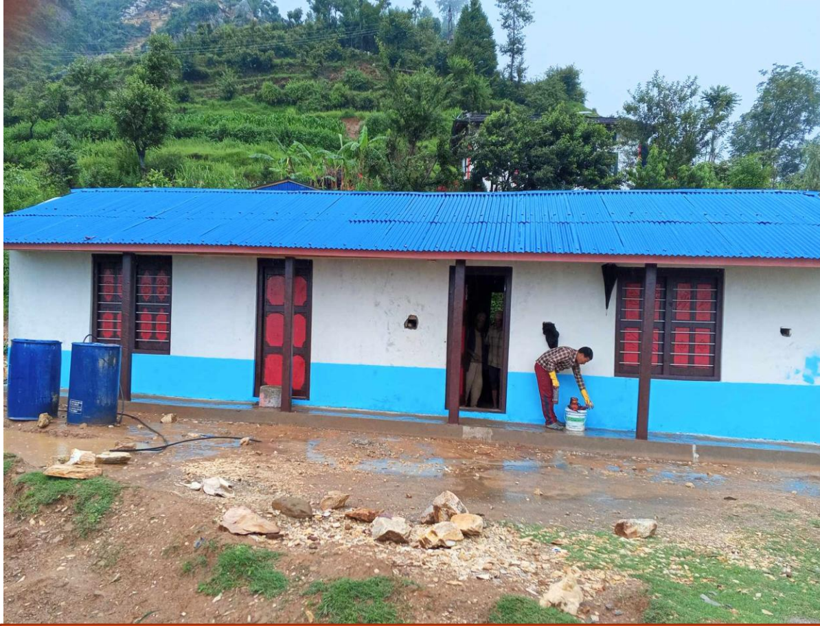
श्री शान्ती प्राथमिक विद्यालय २ कोठे भवन निर्माण बारेकोट ३